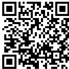
↑ 報名網站 QR code ↓